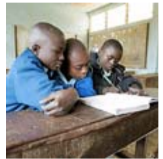
Niños en Nairobi.