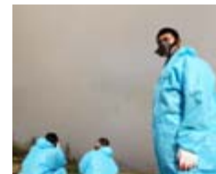
Soldados chinos, ayer.

NUEVA YORK. El estado de Nueva York ha instruido a sus oficinas estatales para que reconozcan los matrimonios gays registrados dentro y fuera de su estado. Las uniones homosexuales también se reconocen en California y Massachusetts.