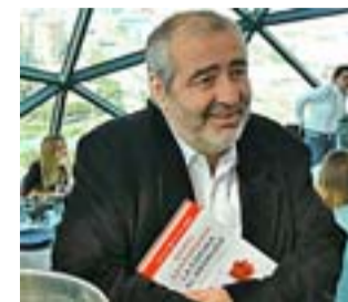
Santi Santamaria, ayer.