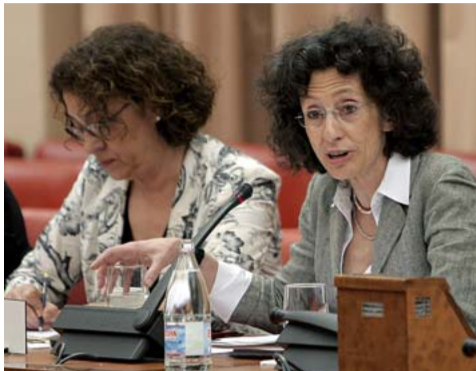
Cabrera, ayer en la Comisión de Educación del Congreso de los Diputados.

Los principales objetivos del Ministerio son ampliar el periodo de escolarización de los estudiantes, mejorar su rendimiento académico, flexibilizar el sistema educativo y reforzar su calidad. Entre las recetas de la ministra están los