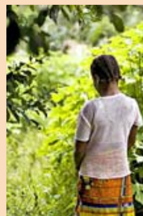
Una menor afectada.

adn.es Video, fotogalería e informe completo www.adn.es/mundo