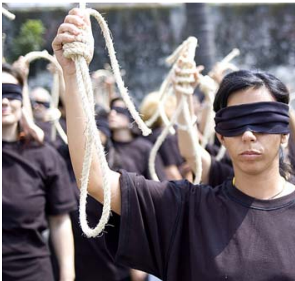
Activistas de AI contra la pena de muerte en un acto el pasado año en México.