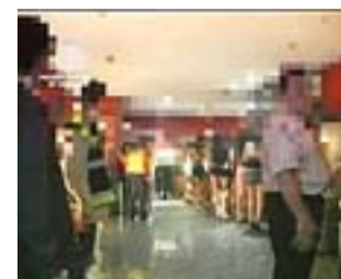
Momento de la operación.