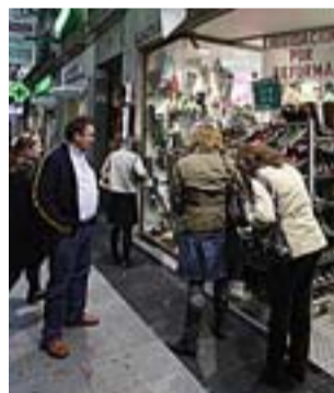
Comercios de Preciados.