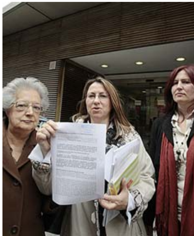
Mujeres de las asociaciones denunciando ayer en Madrid. A.H.

El documento se titula Tratamiento de la violencia de género en España y en la Comunidad de Madrid . Está escrito por la especialista en Economía y De-