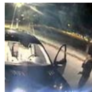
Imágenes del suceso.