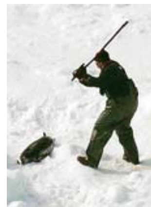
Un cazador captura una foca.