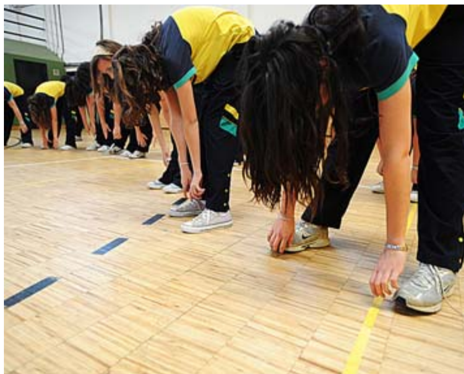
Una clase de gimnasia en el Colegio Mirabal (Madrid), que potencia el deporte.

Otro factor negativo es que, si se hace poco deporte, se tiene una menor capacidad de esfuerzo físico y cualquier ejer-