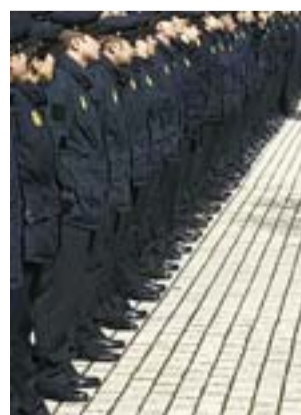
El uniforme de la Policía.

El sindicato policial también ha criticado que los antidisturbios están estrenando furgonetas más modernas, cómodas y mejor equipadas, pero también más grandes, por lo que son poco operativas y se quedan atrapadas en las calles estrechas y los barrios antiguos de muchas ciudades. EFE