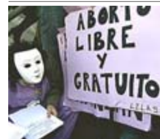
Protesta ante los juzgados.