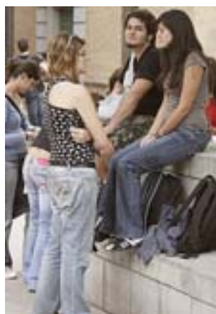
Jóvenes en Barcelona.

En relación a estos datos, el ministro Bernat Soria mostró su "preocupación" porque el 70% de las jóvenes que poseen un Índice de Masa Corporal de delgadez severa