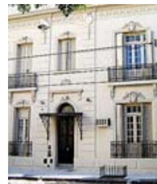
Fachada de la clínica.