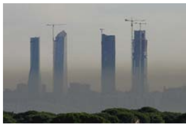
Nube de contaminación sobre la Castellana de Madrid. EFE

No obstante, un 42,8% de los encuestados (más de 2.000 individuos mayores de 15 años) se mostraron contrarios a que se restrinja el uso del automóvil para paliar el calentamiento del planeta. EFE