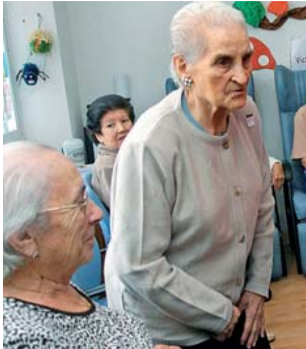
Pacientes de Alzheimer, en un centro de Guadalajara.

Esta vez, el remedio para saciar su hambre tampoco tuvo éxito, pero a cambio los científicos detectaron un área, situada en el hipotálamo –en la base cerebral–, que le hizo recordar con total exactitud una escena de hace 30 años. “Recordó la experiencia de estar en un parque con unos amigos, a los 20 años, y a medida que la intensidad de la estimulación se incrementaba, los detalles se volvían más vívidos. Reconoció a su novia de entonces, y la escena era en