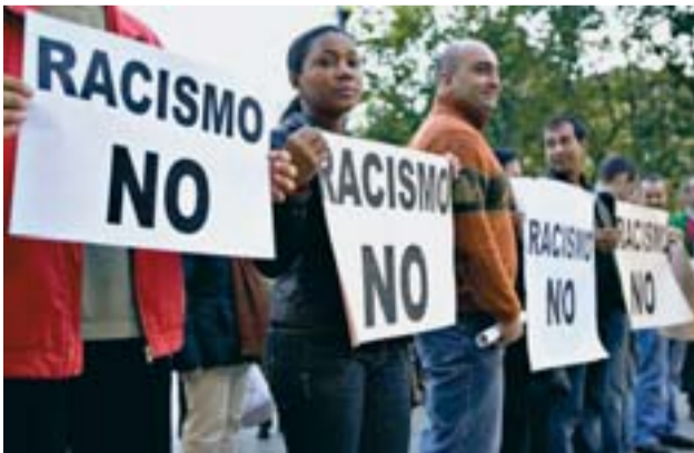
Manifestación contra el racismo, en San Sebastián.

Las organizaciones Amnistía Internacional (AI), Greenpeace e Intermón Oxfam presentaron conjuntamente ayer en Madrid 10 sugerencias sobre estos temas para que sean incluidas en los programas