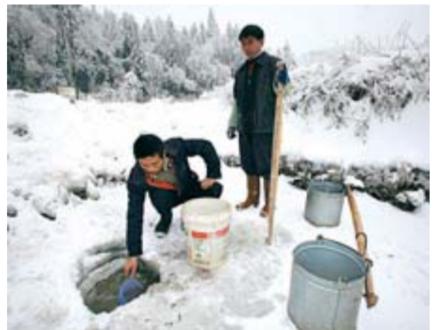
China, en blanco. China vive uno de los peores temporales de los últimos 50 años, que han provocado un auténtico caos en el transporte y más de 60 muertos y 30 millones de afectados. En la imagen, dos hombres recogen agua en un pozo helado en Chongqing, al suroeste del país.