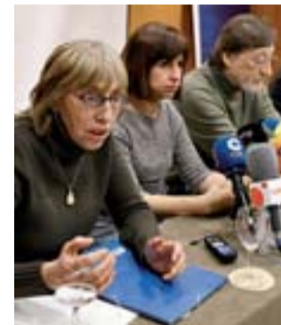
Miembros de ACAI, ayer.