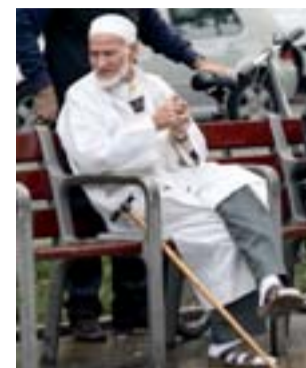
Un hombre, en Barcelona.