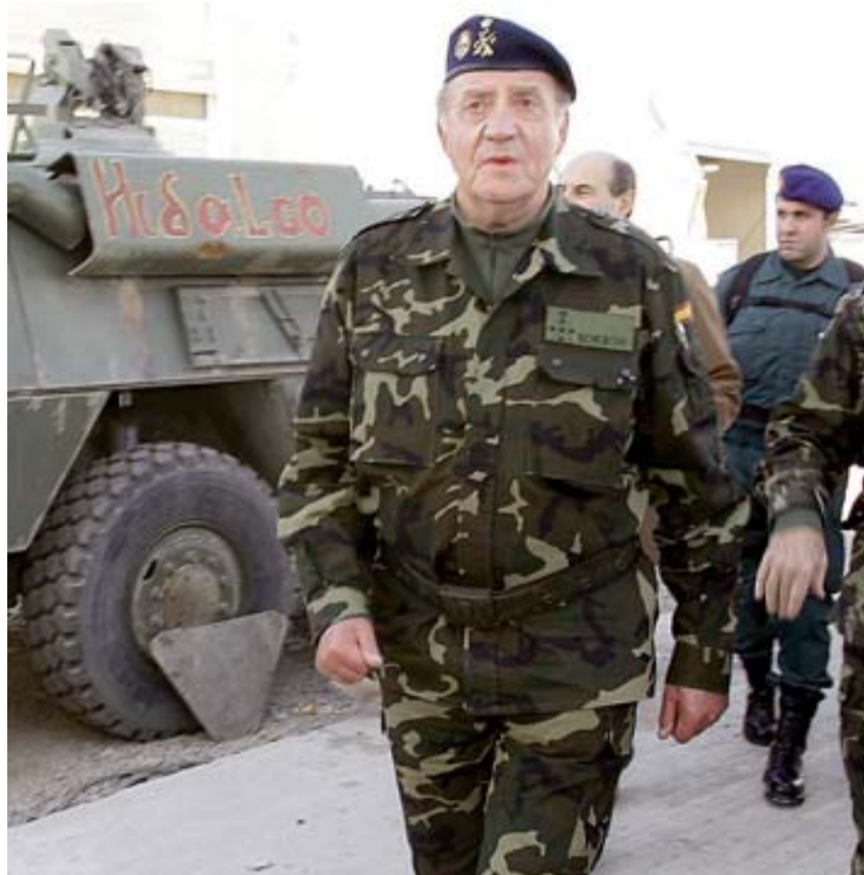
El Rey, durante su visita a las tropas españolas en Afganistán el 31 de diciembre.