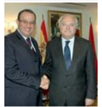
Moratinos y Fassi Fihri, ayer.