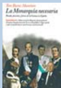
La Monarquía necesaria TOM BURNS Planeta

Burns se confesó “juancarlista, pero sobre todo monárquico”. Según este historiador, la Corona “asegura el bienestar y la prosperidad de España”, pero el proble-