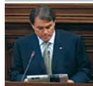
Más leyendo ADN, ayer.

● PSOE e IU-ICV acordaron ayer aplazar hasta la próxima semana la negociación sobre el acuerdo en torno al proyecto de Ley de Memoria Histórica que se tramita en el Congreso. El portavoz de IU-ICV, Joan Herrera, dijo que necesitan un “periodo de reflexión”.