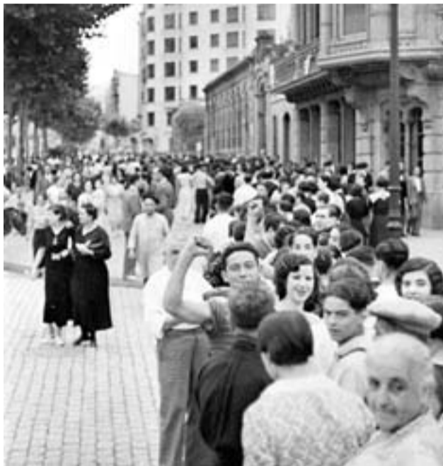
Barcelona, en la zona republicana, en 1936.

El hijo solicitó por escrito en 1984 la devolución de las alhajas, pero el Banco de España rechazó la petición, por lo que decidió acudir a los tribunales. La Audiencia de Madrid absolvió al Banco de España y a la Administración en 1991. Entonces el afectado recurrió ante el Tribunal Supremo (TS), que decretó la responsabilidad del Estado