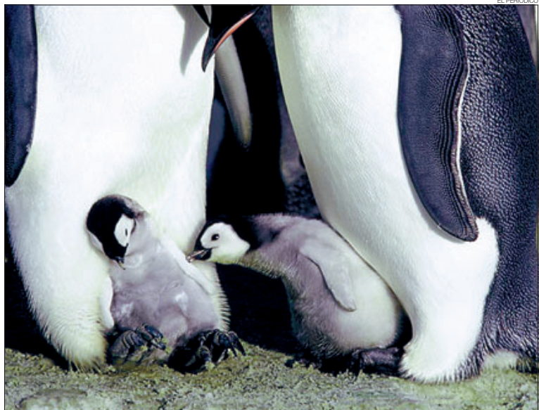
Una imagen de El viaje del emperador .

En la versión en castellano, la aventura que viven estas aves es narrada por los actores José Coronado y Maribel Verdú. Ellos ponen voz a una pareja de pingüinos que logra que su